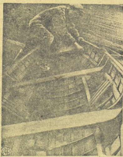
К ЛЕТНЕМУ СПОРТИВНОМУ СЕЗОНУ На сн: Ремонт лодок на стадионе „Динамо“. КЕСÄURHEILUKAUTEEN SIIRYTTÄESSÄ Kuvassa: Veneiden remontti „Dynamon“ stadionilla.