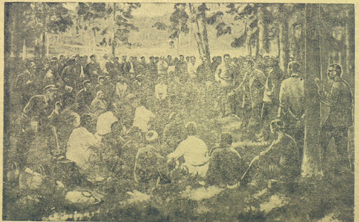
Массовка в лесу. (Худ. Владимирский. Музей революции СССР). Joukkokokous metsässä. (Taiteilija Vladimirskij. SSSR:n vallankumousmuseo)